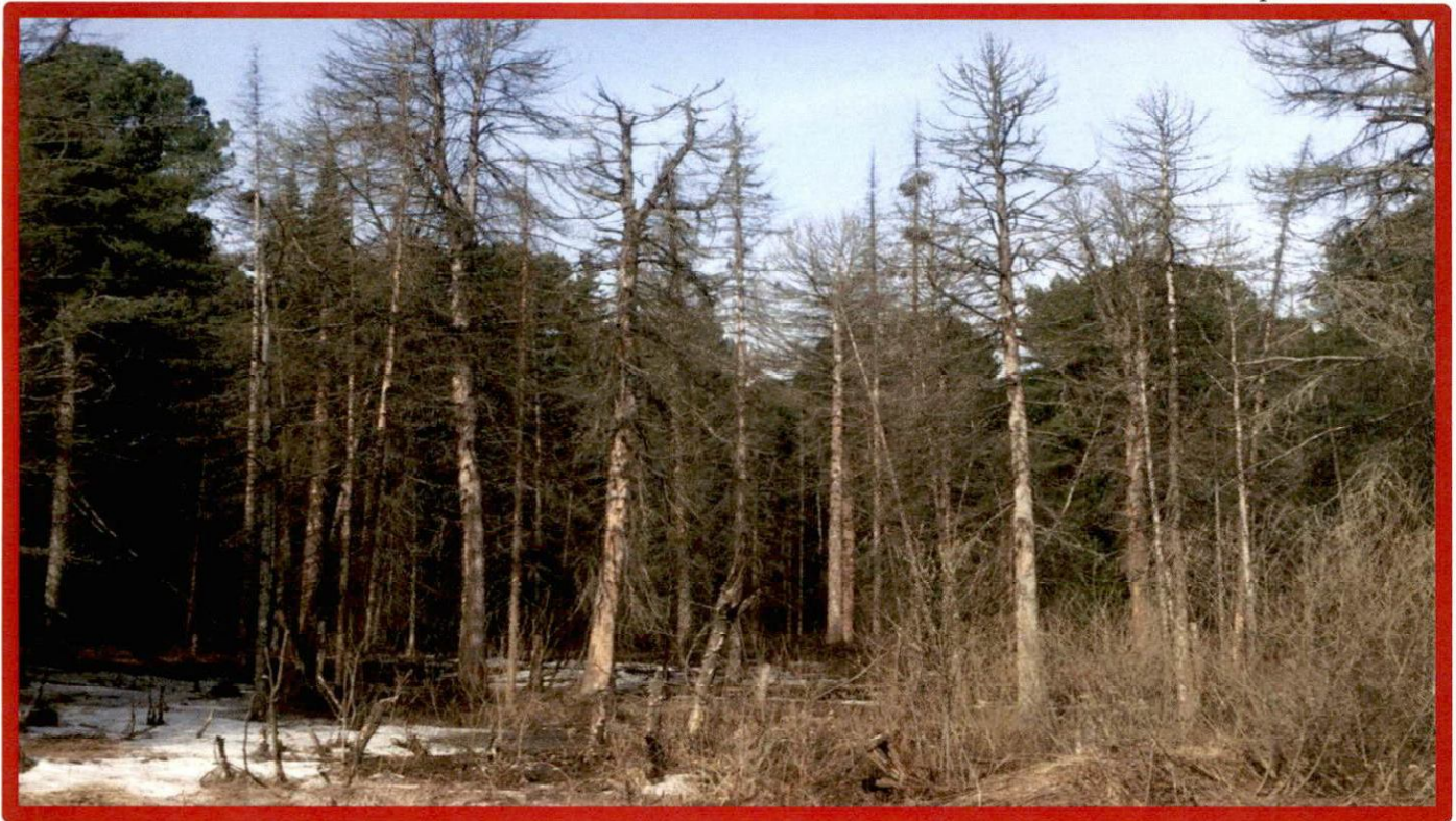
Изображение № 4 Сухостойное дерево. Не является валежником Изображение № 5

Кроме того, необходимо обратить внимание, что деревья, которые лежат на земле, но не имеют признаков естественного отмирания (имеют зеленую листву или хвою), определять как «мертвые» не допускается (смотри изображение № 5).