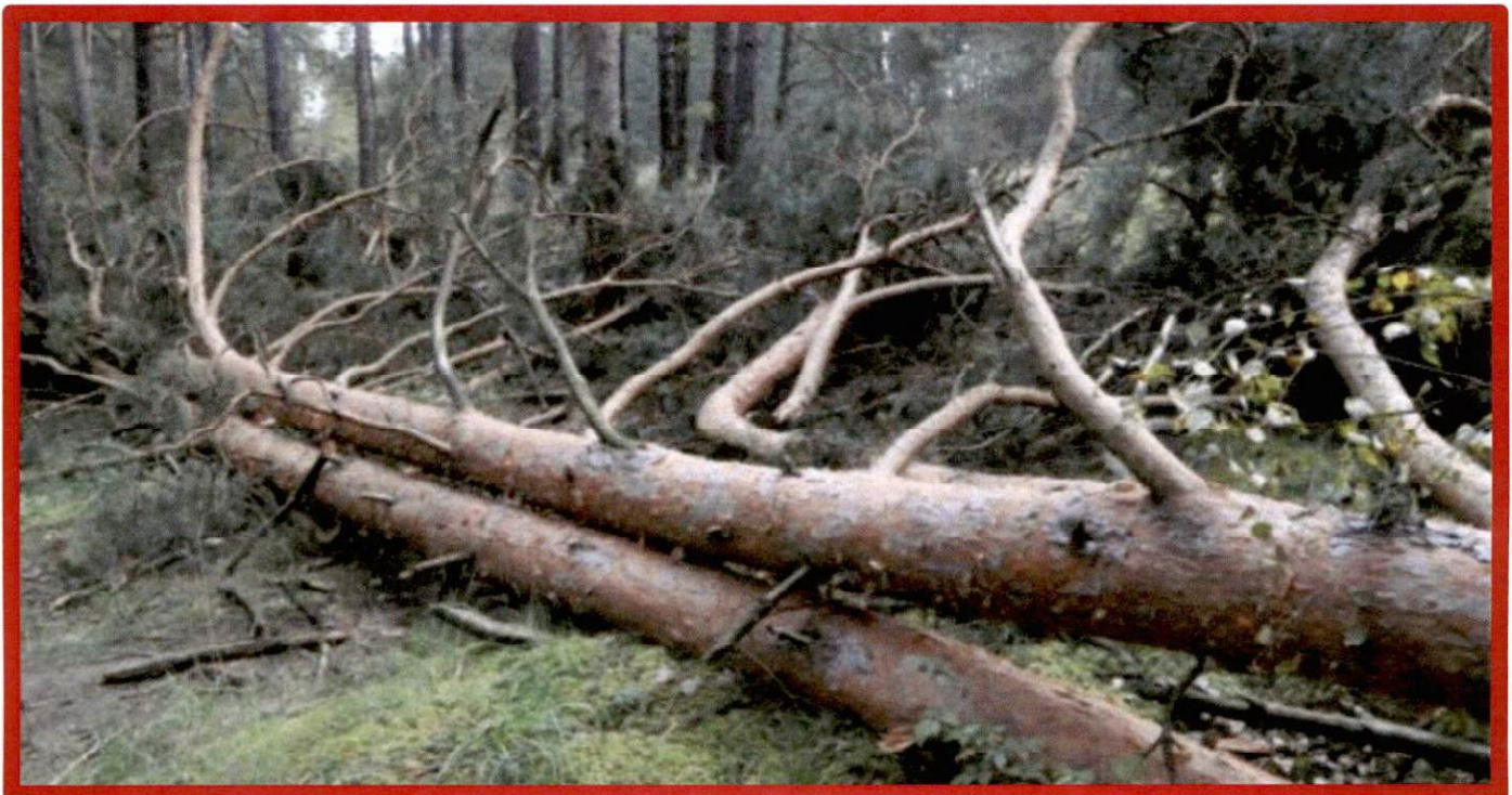
Лежащее на поверхности земли ветровальное дерево, не имеющее признаков отмирания. Не является валежником

Кроме того, необходимо обратить внимание, что деревья, которые лежат на земле, но не имеют признаков естественного отмирания (имеют зеленую листву или хвою), определять как «мертвые» не допускается (смотри изображение № 5).