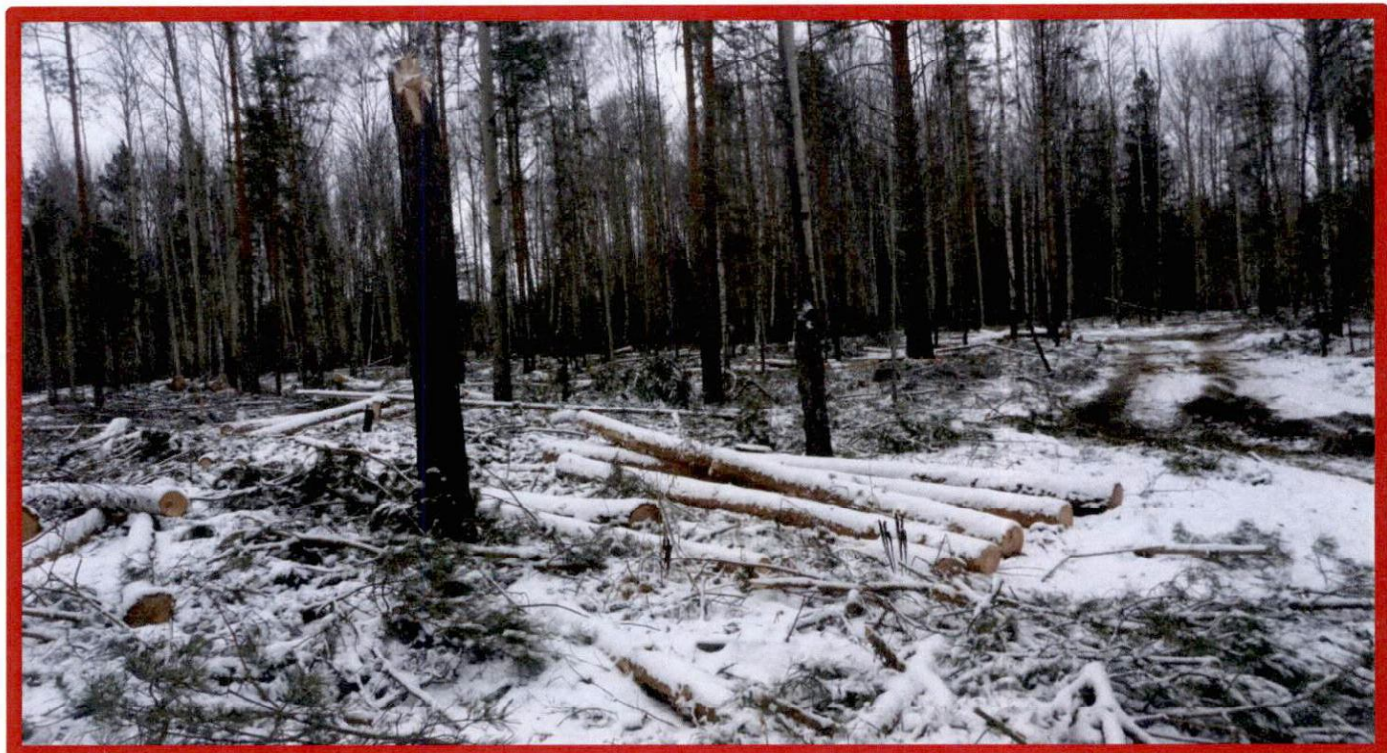
Изображение № 7 Брошенная древесина вдоль лесовозных дорог. Не является валежником